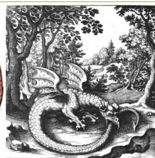
Гравюра Лукаса Дженниса (Lucas Jennis) в алхимическом трактате "De Lapide Philosophico"