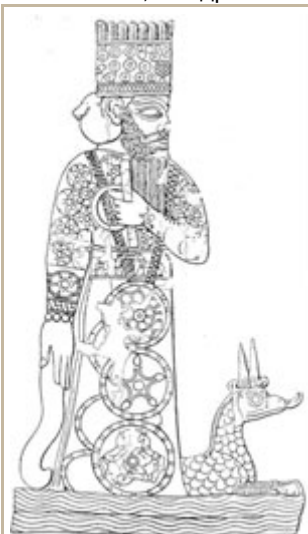
Древний месопотамский бог Мардак и его дракон, на вавилонской печати

О первых найденных окаменелостях динозавра когда-то думали как о "костях дракона". Это открытие, сделанное в 300 году до н.э. в провинции Сычуань в Китае, было названо Chang Qu . Маловероятно, но есть шанс того, что именно это открытие вызвало легенды о летающих монстрах, или укрепило их.