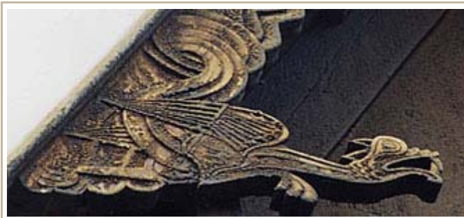
Дракон, вырезанный на фасаде церкви Хопперстад (Hopperstad) в Норвегии

В "Откровении" глава 12, стих 3, описано огромное красное животное с семью головами, чей хвост охватывает одну треть звезд от Небес до Земли земле (символизирующее падение ангелов). В большинстве переводов, для обозначения этого животного используется именно исходное греческое слово "дракон" (drakon).