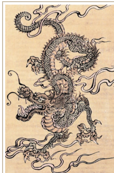
Китайский дракон, гравюра выполненная в стиле китайской школы, XIX-й век

Все драконы, какие только известны человечеству, собраны здесь воедино. Как их называют, свойства, присущие драконам и восприятие драконов различными культурами человечества