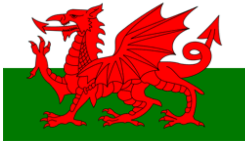
Красный дракон на Флаге Уэльса