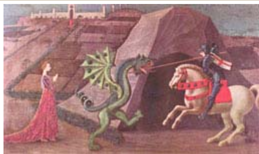
Святой Джордж убивает дракона. Картина Паоло Уккело, 1470 г.