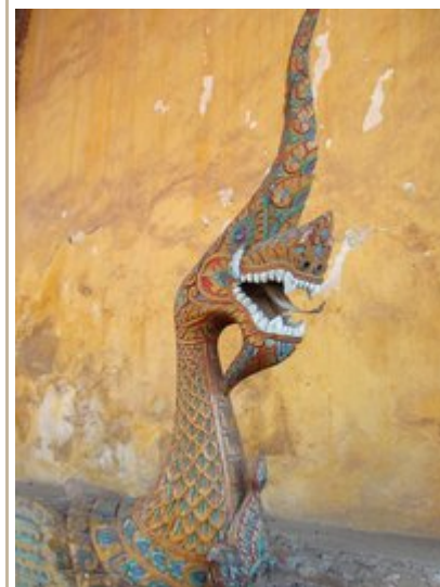
Нага-охранник храма Уот Сизакета в Канале Viang, Лаос

Справедливо ли такое обвинение? Я внимательно думал над этим, в течение многих лет наблюдая сотни, может быть, и тысячи людей как священник. И я в конце концов убедился, что это неверно. Это неверно потому, что как раз мысль о том, что