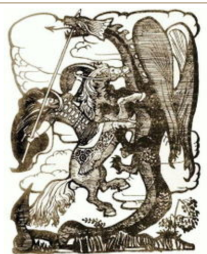
Добрыня Никитич убивает Змея Горыныча, Автор Иван Билибин

доступ к его сокровищам, но и подразумевало, что герой победил самого хитрого из всех существ. В некоторых культурах, особенно китайских, и гималайских, драконы, как считается, приносят удачу.