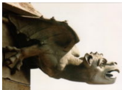
Водосточная труба в виде дракона в Ulm Munster

Фигурки драконов часто держатся в домах, и имеют духовное значение в различных религиях и культурах во всем мире. Так происходит во многих восточных и американских (коренных) культурах, и в некоторых других, и являются представителями основных сил природы и вселенной. Во многих культурах говорится, что они более мудры, чем люди. При этом, драконы обладают способностями волшебства или другими паранормальными способностями, и часто связываются с колдовцами, дождем и реками. В некоторых культурах, драконы даже могут говорить на человеческом языке