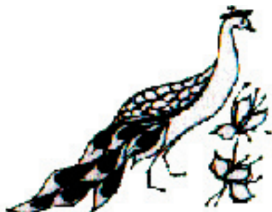
Рис. Ольги Князевой