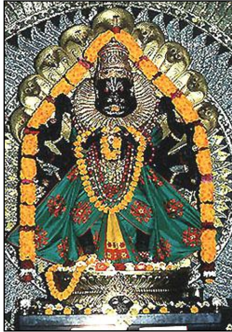
“Господь Нрисимхадев – Он добрый, но страшный”.