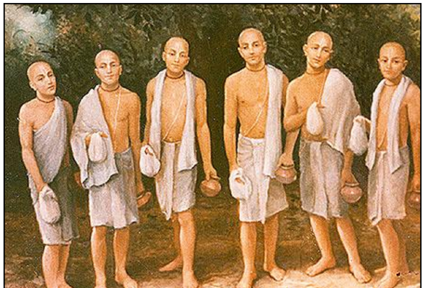
Рагхунатха Джива Санатана Рупа Гопал Рагхунатха Бхатта Госвами Госвами Госвами Бхатта дас Госвами Госвами

Пожилые и старые мужчины и женщины относились к Санатане, как к своему сыну. И порой