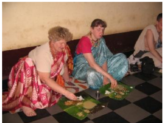
Прасад в храме Удупи Шри Кришны

Также накануне нас накормили в храме Удупи Шри Кришны. Там особая церемония раздачи и принятия прасада. Сначала, как обычно, раздают банановые листья, которые можно сполоснуть водой. Стаканы с водой ставят по одному на двоих (то ли у них за едой пить не очень принято, то ли стаканов не хватает). Сначала разносят по одной ложке всяких приправ. Потом кладут большую кучу риса, который надо рукой разделить на три кучки и сделать в них по ямке, так как еще три раза понесут к рису заправку. Сначала разносят дал, который выливают в первую рисовую ямку. Если вы рассчитываете, что съедите много, то можно залить далом весь свой рис, а потом взять добавки, которую будут еще разносить два раза. Но мало кто способен на такой подвиг, так как все огненно острое. После этого несут опять тот же рис и