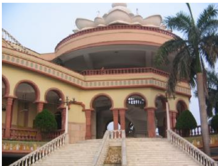
Вход в самадхи Шрилы Прабхупады в Майапуре

Несколько раз мы ездили на океан. Здесь очень хороший песчаный пляж. На берегу стоит храм Господа Баларамы. Это Божество Мадхвачарья нашел