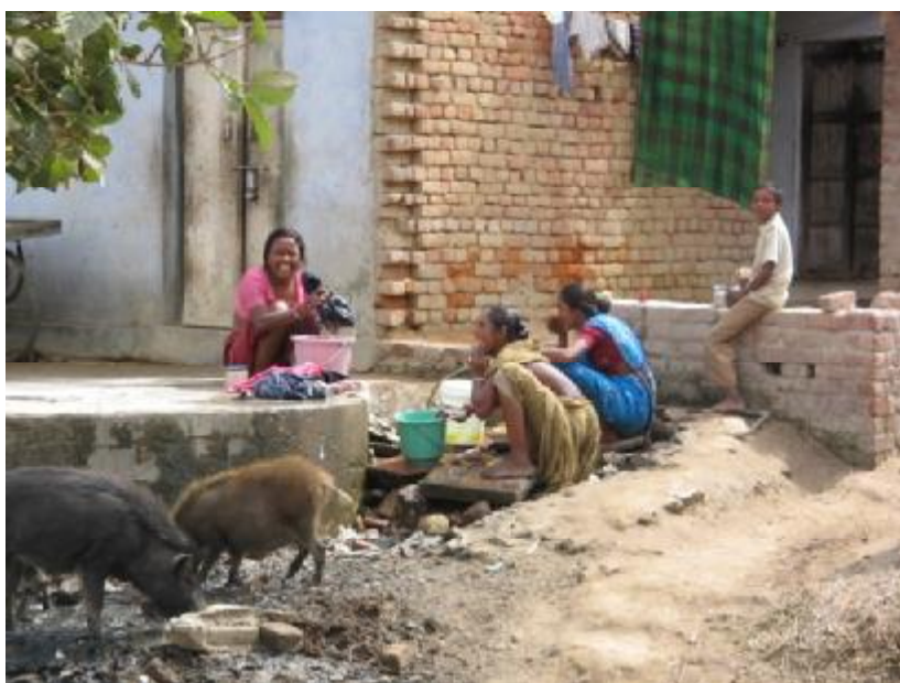
Враджаваси очень улыбчивы и приветливы

Во Вриндаване Говинде Нандини сразу все очень понравилось: свинки, коровы, верблюды, торговцы, Ямуна, храмы, дома, еда, одежда. Мы встретили