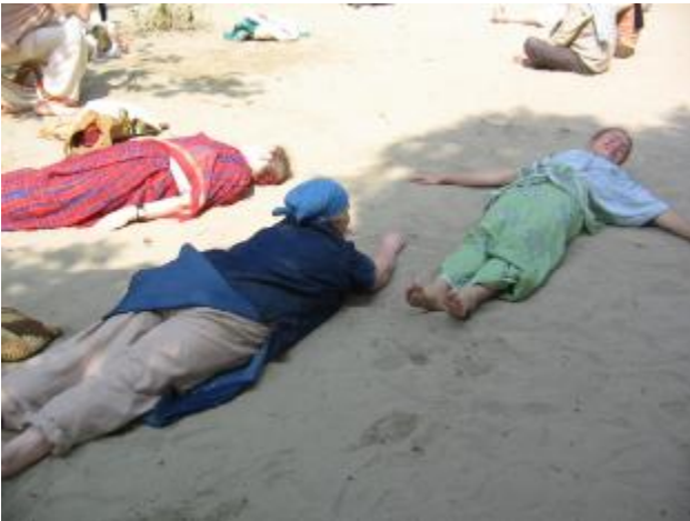
В песках Рамана-Рети