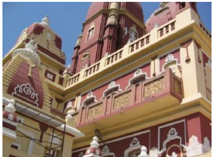
Храм Лакшми-Нараяны в Дели

Обратно мы летели почти без приключений, не считая того, что рейс задержали на 3 часа. Рядом было несколько преданных, видеть лица которых было приятнее всего. Но они были не очень-то разговорчивы.