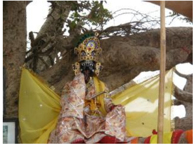
Чир-Гхата. Кришна, укравший одежды гопи

Вот и дерево, под которым гопи оставили свои сари, чтобы искупаться в Ямуне, а Кришна украл их. Это место называется Чир-гхата. Сидя на дереве,