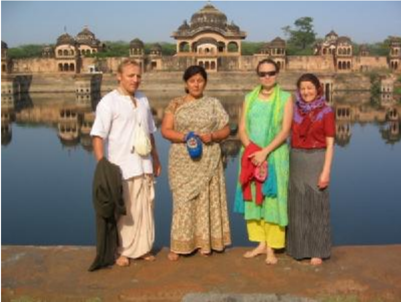
Кусум-саровара на Говардхане