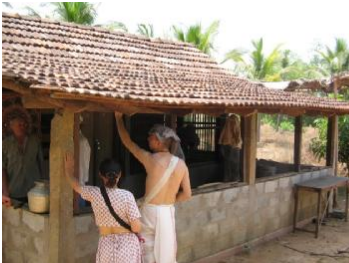
Бхаджан-кутир Гададхары Пандита пр. в Удупи на берегу реки Суварны

заливают овощным супом самбар (кстати, что такое сабджи, в Южной Индии никто не знает). Затем отдельно разносят сладкий рис. И напоследок – опять первый рис, который заливают соленой пахтой. Считается, что нельзя заканчивать трапезу сладким блюдом, так как тогда останется неудовлетворенность.