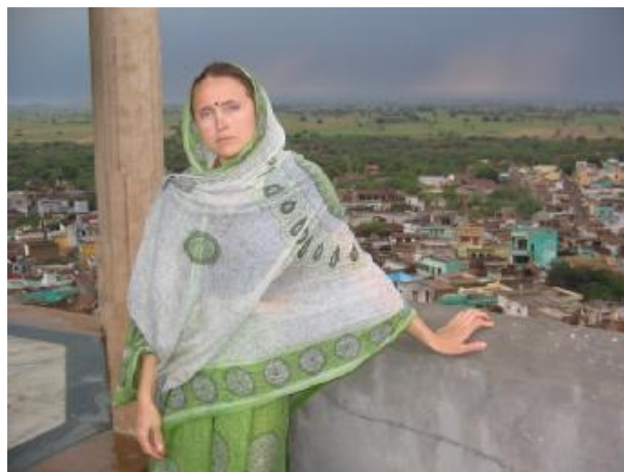
Вид сверху на Нандаграм

Говорят, что на холме Говардхан по-прежнему играют Кришна и Баларама с мальчиками-пастушками и телятами. Они лазают по деревьям, бегают друг за другом, прячутся в пещерах и перекусывают сладостями, которые заботливо