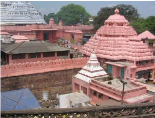
Двор храма Господа Джаяганнатхи в Пури