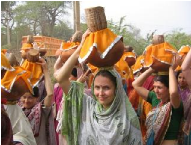
Парикрама по Нандаграму

Впечатления от Вриндвана такие, что словами их просто невозможно выразить. Я в полной мере ощутила очищающую силу дхамы. Я просто физически чувствовала, как сгорает моя карма и