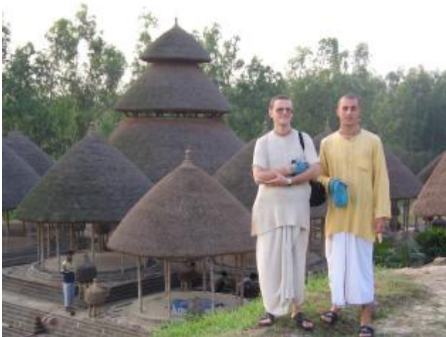
Возле новой гурукулы в Майапуре