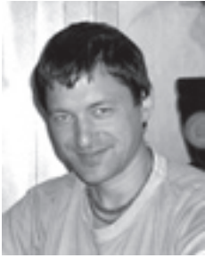
Слово издателя Раса Рашики Прабху:

«Прогресс» современной цивилизации идет стремительными темпами. Но отношения между людьми, как и в далекой древности, играют важную роль в жизни человека. Самые значимые - это отношения между близкими в семье. Когда эти отношения трещат по швам, это сказывается на всем. Наши поколения не могут похвастаться крепостью брачных уз. Разводы составляют более 80%. В большей степени ответственность за домашний уют, за крепость семьи лежит на женских плечах, тем не менее, и мужчины, и женщины однажды задают себе вопрос: что я готов принести в жертву на алтарь домашнего очага? Свои привычки, мнения, поступки, время, силы, умения. Не положить ничего - домашний очаг погаснет, положить больше другого - вдруг это войдет в традицию, и я стану вечным костровым. Сомнения, опасения, страх живут в сердце каждого, а в минуты выбора их голоса слышны особо громко. Давайте посмотрим, как справлялись с подобным вопросом великие женщины прошлого, прославившиеся в веках своей добродетелью.