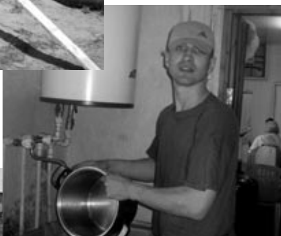
Чистота – наша сила!