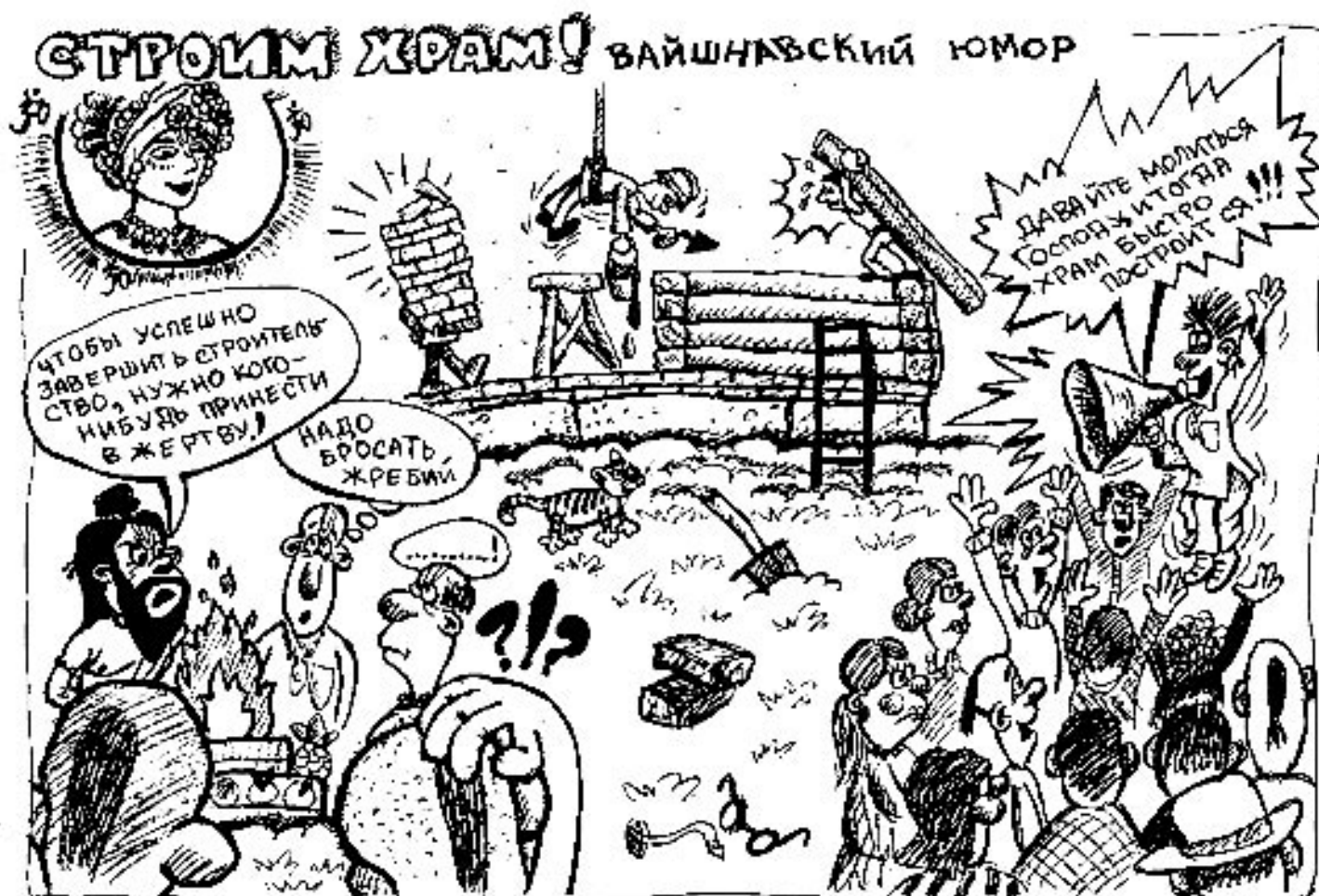
Рис. Уткала дас, Омск, март 2008 г.

ЖЕЛАЕМ ВАМ ОБРЕСТИ ВКУС СЛУЖЕНИЯ ГУРУ И ВАЙШНАВАМ!