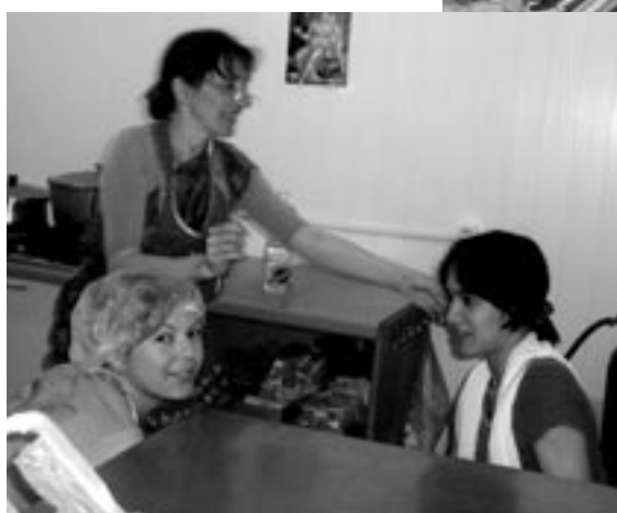
Спасибо нашим поварам за то, что вкусно варят нам!