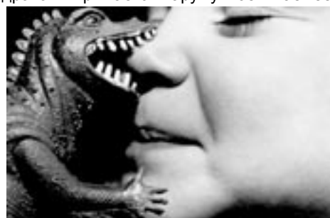
Джон Грей «Мужчины с Марса, женщины с Венеры»

Крайне важно, чтобы женщины поняли: ни в коем случае не следует пытаться заставить мужчину заговорить прежде, чем он сам будет к этому готов. Во время обсуждения данной темы на одном из моих семинаров слушатель-индеец рассказал: в его родном племени, готовя девушек к замужеству, матери наказывают им всегда помнить, что в моменты неудач и переживаний мужчина имеет