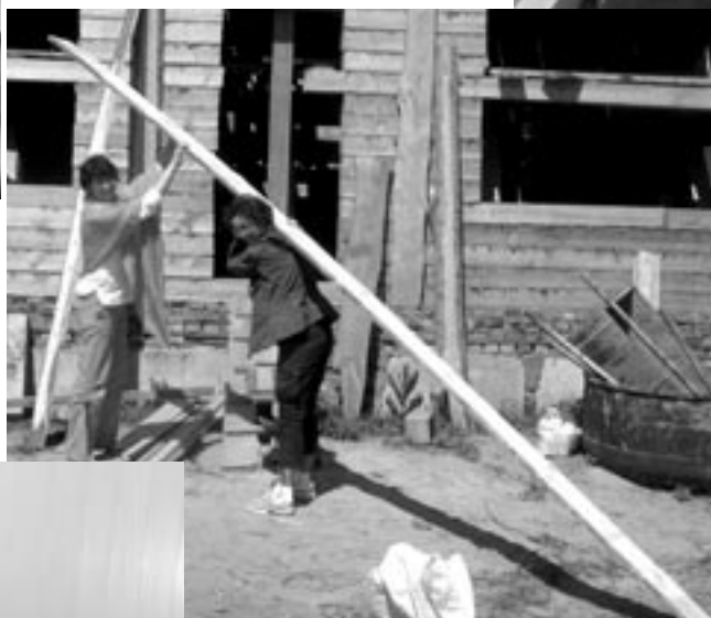
Что нам стоит храм построить?!

Есть матаджи в омских селеньях – В горящую избу войдут, Слона на бегу отановят И хобот ему оторвут!