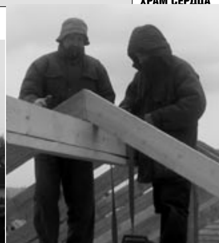
Крыша – это Сам Кришна!