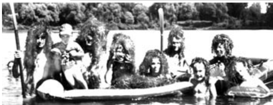
Добыча речной капусты

Предлагаю вам оригинальный рецепт вегетарианской ухи из морской капусты, которая сама по себе весьма богата витаминами, микроэлементами и йодом. Пусть вас не пугает, что морская капуста будет пахнуть рыбой – это всеобщее заблуждение. Открою вам секрет - на самом деле это рыба пахнет морской капустой и водорослями, потому что ест их.