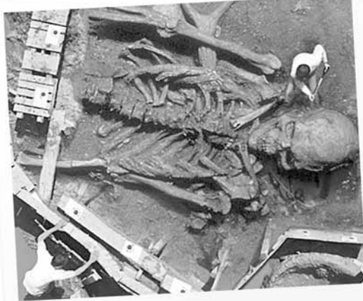
сравните размеры двух человек с размерами найденного скелета

лись. Считается, что один из сыновей Бхимы из рода Пандавов, тоже был носителем этих генов. Позднее эти люди, наделенные всей властью, направили ее против наших Богов и перешли все установленные границы. Как результат, их уничтожил Господь Шива. Команда исследователей журнала “National Geographic” считает, что эти останки принадлежат одному из таких людей.