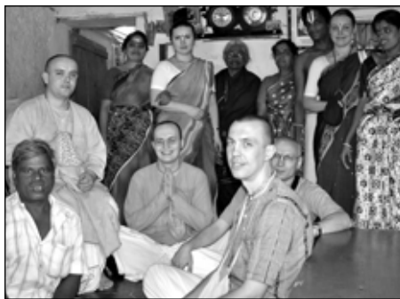
Паломничество по Индии, 2005 год