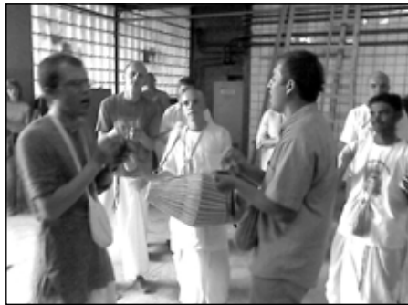
Киртан в крематории

вовал, что мне нужно ещё остаться, но с другой стороны, я понимал, что должен ехать. Когда мы уже выехали из Киева на автобусе в Польшу, я рассказал преданным, что Баларама прабху уже вот-вот оставит тело. Мы практически всю дорогу пели святое имя, мы молились. А в моем уме всё время звучал его стон. После того, как я оставил его, я практически каждый день звонил и спрашивал как у него дела.